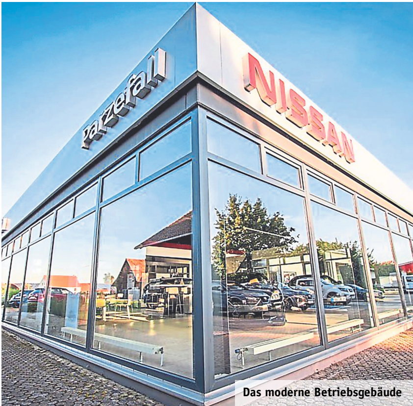
Das moderne Betriebsgebäude